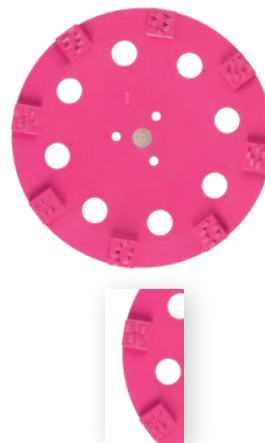
PCD Piranha Ø 300/22.2 mm