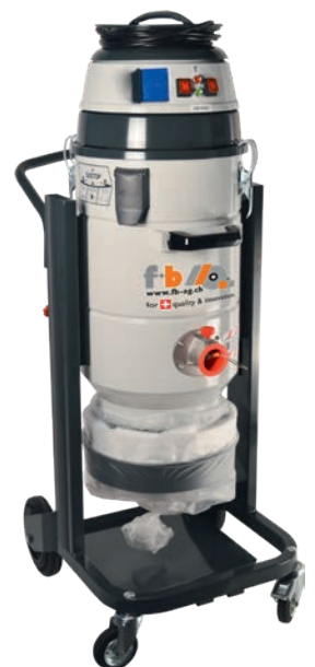
fb VAC 202 DS-LP