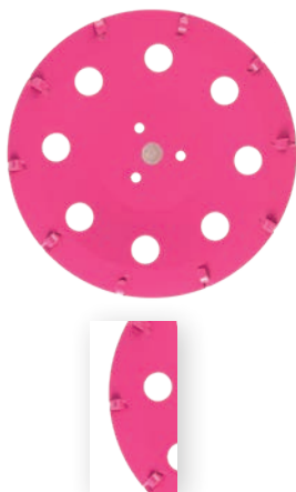
PCD Taifun Ø 300/22.2 mm