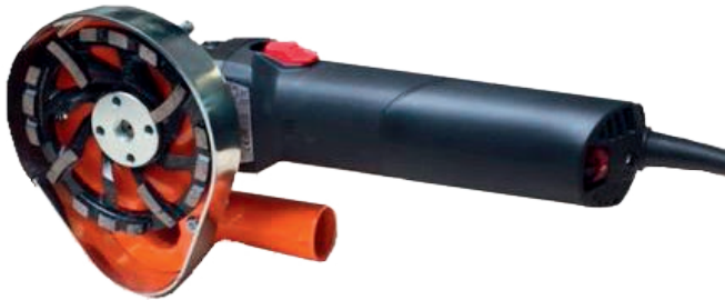
Betonschleifer mit Drehzahlregulierung fb 1550-125-CG