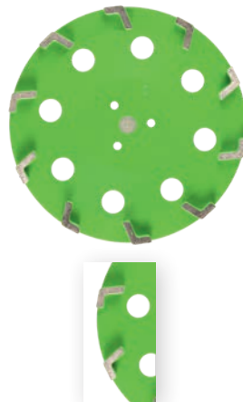
Diamantteller Hurrikan Ø 300/22.2 mm