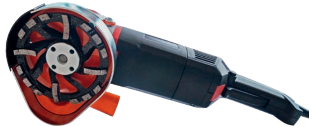
Betonschleifer fb 1700-125-CG