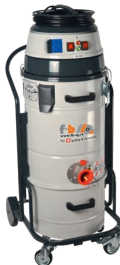
fb VAC 202 DS