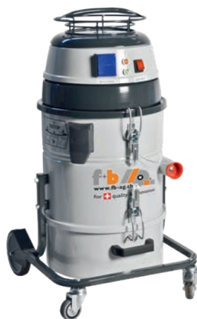
fb VAC 301 DS