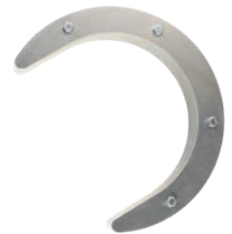
Zusatzgewicht max. 10 kg