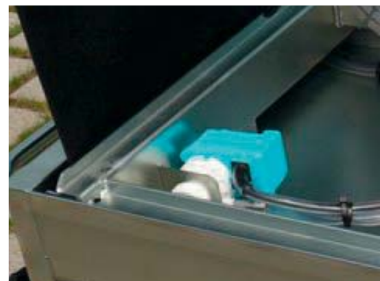
Im Rahmen integrierte, steckbare Wasserpumpe, ermöglicht ein schnelles, werkzeugloses Ersetzen der Wasserpumpe.