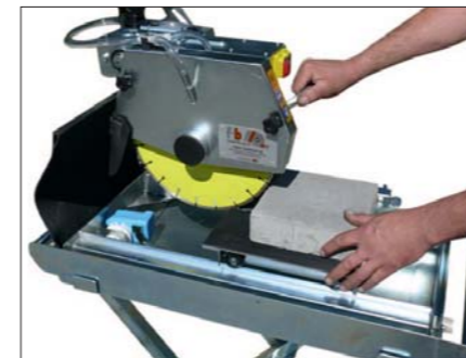
Problemloses Schneiden von Verbundsteinen.