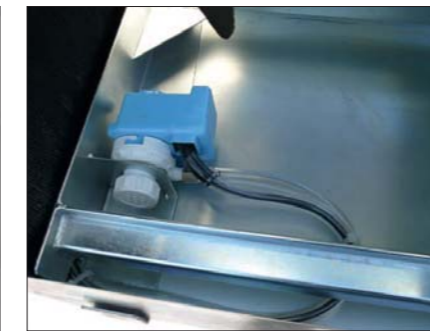
Im Rahmen integrierte Wasserpumpe.