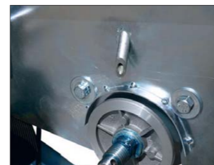
Sichere doppelte Wasserzufuhr zur Kühlung und Schonung der Diamanttrennscheibe.