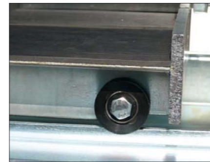
Auf Präzisions-Metallrollen/-Kugellagern geführter Schneidetisch für sicheres und präzises Arbeiten.