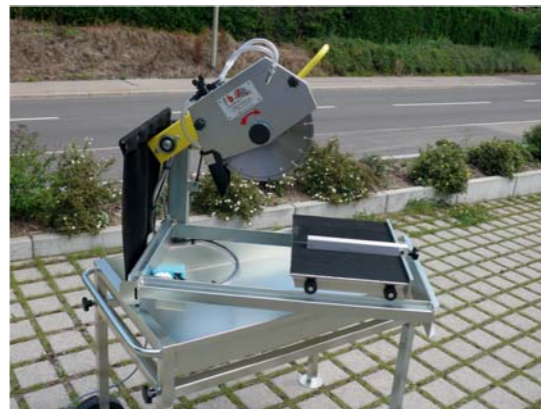
...ermöglicht sehr gutes Handling und ist praktisch für eine saubere Reinigung der Maschine.