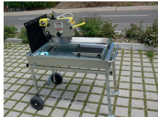
Eine solide und kompakte Steinfräse für universelle Gartenarbeiten.