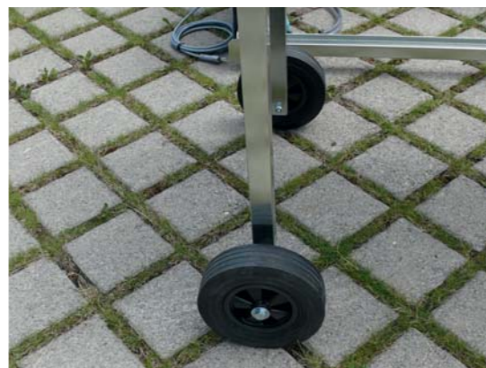
Standbeine mit soliden Laufrollen zur praktischen Verschiebung auf der Baustelle.