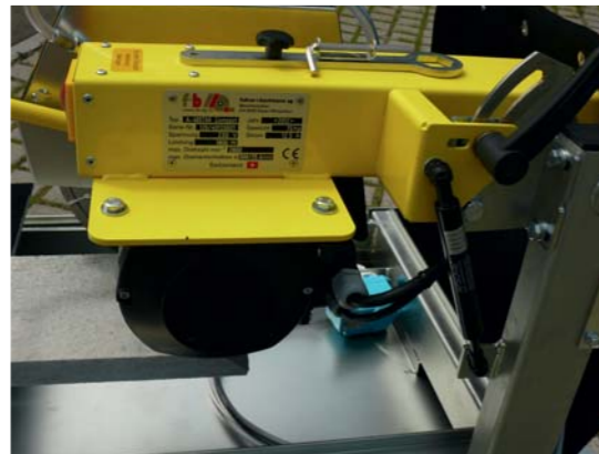
Schneide-Wippkopf mit Gasdruckdämpfer ermöglicht ein präzises und bequemes Arbeiten.