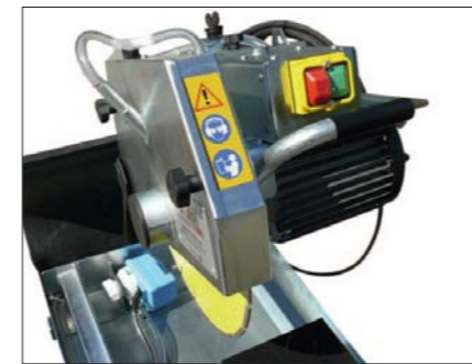
Integrierter versenkter Schalter und ein mehrfach gelagerter Wippkopf sichern Langlebigkeit und hohe Funktionalität.