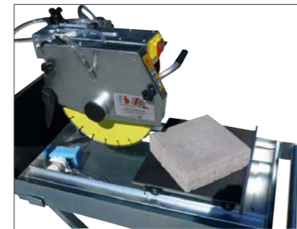
Diagonalschnitt von 30 x 30 cm einfach und sauber.

Motor: 1.8 kW / 230 V Dia-Schutz: 300 mm Schnitttiefe: 85 mm Schnittlänge: 450 mm Gewicht: 53,5 kg (8+32,5+7+6), 4-teilig (X-Gestell, Rahmen mit Motor, Wasserwanne, Rolltisch)