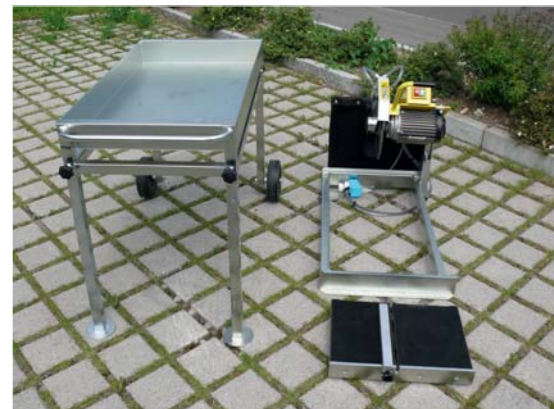
Das mehrteilige Maschinenkonzept...